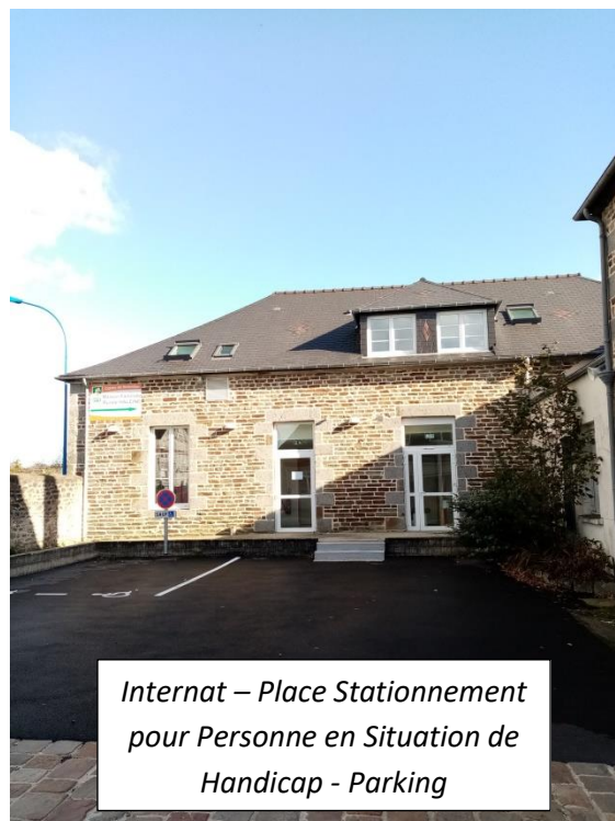
Internat – Place Stationnement pour Personne en Situation de Handicap - Parking