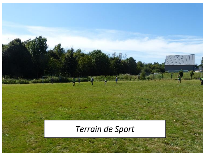
Terrain de Sport